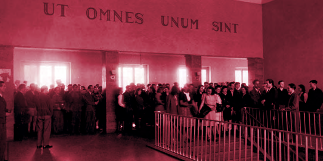
Das Motto der Universität Mainz in der alten Mensa um 1950