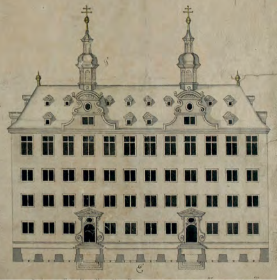
Ansicht der alten Universität (Domus Universitatis) 1723