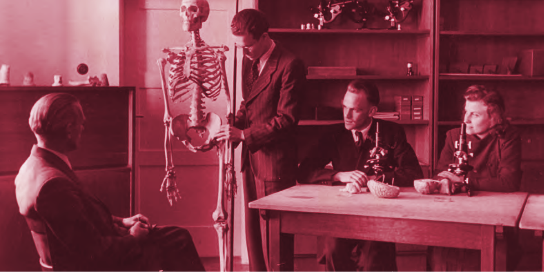
Im anatomischen Institut, um 1948

Die meisten Gebäude ihrer sechs Fakultäten (Katholische und Evangelische Theologie, philosophische Fächer, naturwissenschaftliche Fächer, Jura, Medizin) kamen als Campus-Universität in einer ehemaligen Flak-Kaserne im Nordwesten der Stadt unter, die medizinischen Kliniken ab Dezember 1946 im bisherigen Städtischen Krankenhaus. Auf Äckern Mainzer Pfarreien entstand der Botanische Garten. 1947 folgte das Dolmetscherinstitut (heute Fachbereich 06) in Gernersheim. Trotz enormer materieller Schwierigkeiten in den Anfangsjahren, besonders beim Ausbau der naturwissenschaftlichen Institute, und der bald einsetzenden Konkurrenz anderer Hochschulen, konnte sich Mainz als Landesuniversität des 1947 gegründeten Landes Rheinland-Pfalz behaupten. Als bundesweit vorbildliche Innovation hat die Einrichtung des „Studium generale“ zu gelten, in dem die einzelnen Fächer als „Universitas“ den Studierenden den universellen Sinn von Wissenschaft vermitteln können. So konnte den Zeitgenossen die erfolgreiche Universitätsgründung als „Wunder von Mainz“ erscheinen.