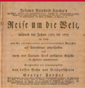
Georg Forster und sein Reisebericht um 1784