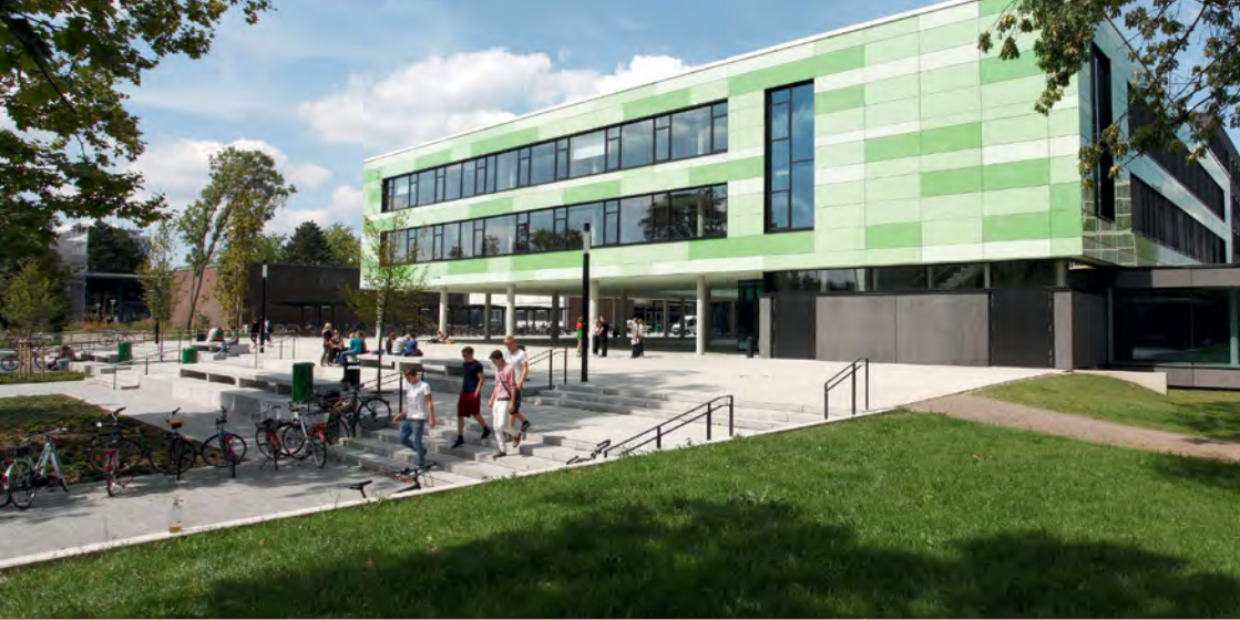
Georg Forster-Gebäude auf dem Campus der JGU 2014

Durch rege Bautätigkeit trug die Universität den wachsenden Studentenzahlen Rechnung. Mit dem 2013 fertiggestellten Neubau für die Sozialwissenschaften, dem Georg Forster-Gebäude, wurde dabei ein markanter Akzent in der urbanen Entwicklung des Gutenberg-Campus gesetzt. Das Bemühen um die Internationalisierung von Forschung und Lehre brachte der JGU mehrfach (2004, 2007, 2011 und 2013) das Qualitätssiegel E-Quality des europäischen Austauschprogramms ERASMUS ein. Es bestehen Partnerschaften mit über 140 ausländischen Hochschulen. Der Partnerschaft Mainz-Dijon kommt in der Tradition der deutsch-französischen Freundschaft dabei besondere Bedeutung zu. Für ihre Anstrengungen zur Erhöhung der Geschlechtergerechtigkeit gewann die JGU viermal (2005, 2008, 2011 und 2014) den Total-E-Quality Preis. In der Exzellenzinitiative des Bundes konnte sie 2012 die Bewilligung der Exzellenzcluster PRISMA und der Graduiertenschule MAINZ erreichen.